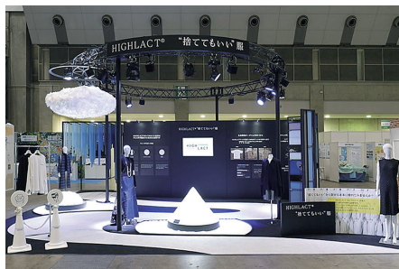
ブース写真 〔デザイン・施工・演出：(株)NHKアート〕

先日開催された、エコプロ2022（12月7～9日 東京ビッグサイト）において、ハイケム社の展示ブース内でディスプレイ用資材として紹介しました。ハイケム社は、ディスプレイパネルや文字装飾パネルとして「RETONA FOAM BIO」を使用したほか、次世代のサステナ素材「ハイラクト®」からできたアパレルの展示やファッションショーを行うなど、地球環境に配慮したサステナブルな展示提案を行いました。現在、展示会や見本市などのブース装飾は、会期終了後の大量廃棄が課題となっています。廃棄後、水と炭酸ガスに分解される「RETONA FOAM BIO」は、環境負荷低減が可能な素材として使用することが可能です。